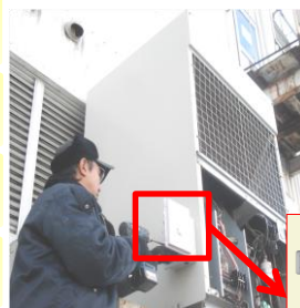
室外機に取り付け

本補助金では、室内温度を監視しながら、空調を駆動制御するシステムを導入します。快適性を維持しながら消費電力を削減する環境に配慮した個別対応型省エネシステムです。例えば20分に3分間止めることで15%の空調費削減につながります。